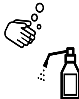
手洗い・手指の消毒

当館では新型コロナウイルス感染拡大防止のため、全力を挙げて取り組んでまいります。 ご理解・ご協力のほどお願いいたします。